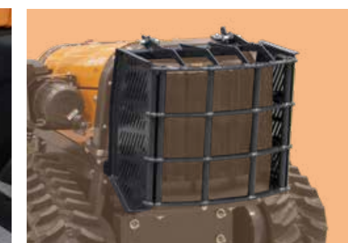
Klappbarer Kühlerschutz aus Stahl