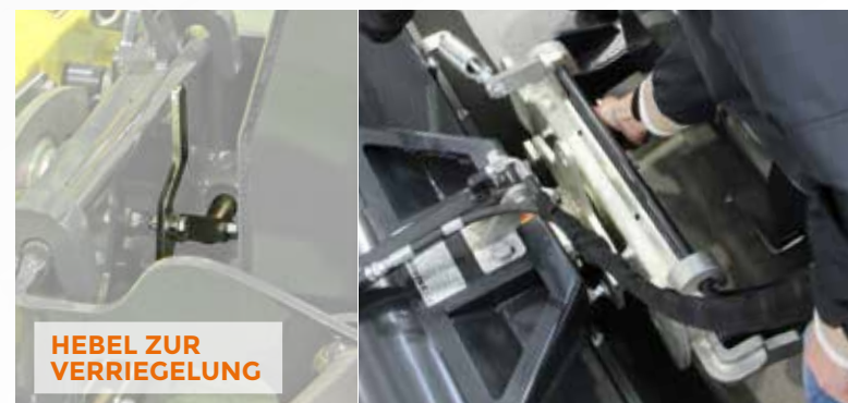
HEBEL ZUR VERRIEGELUNG

Der funkgesteuerte Geräteträger RoboEVO ist mit einem speziellen Fronthubwerk, das auch den schnellen Wechsel der Anbaugeräte ermöglicht, ausgestattet, Schnellkuppler für Hydraulik sind optional verfügbar. Alle aktuellen und früheren Anbaugeräte von Energreen - auch die der Vorgängermodelle - in dieser Kategorie passen auch an der neuen RoboEVO . Dieses System reduziert und vereinfacht die Rüstzeit, ermöglicht multifunktionalen Geräteeinsatz und trägt so zur Wirtschaftlichkeit bei.