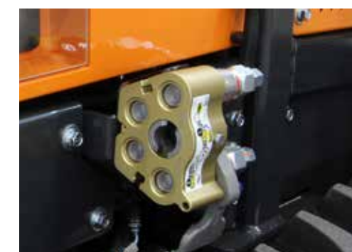
Hydraulik Schnellkuppler (CEJN)