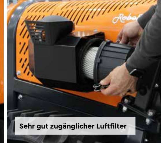
Sehr gut zugänglicher Luftfilter