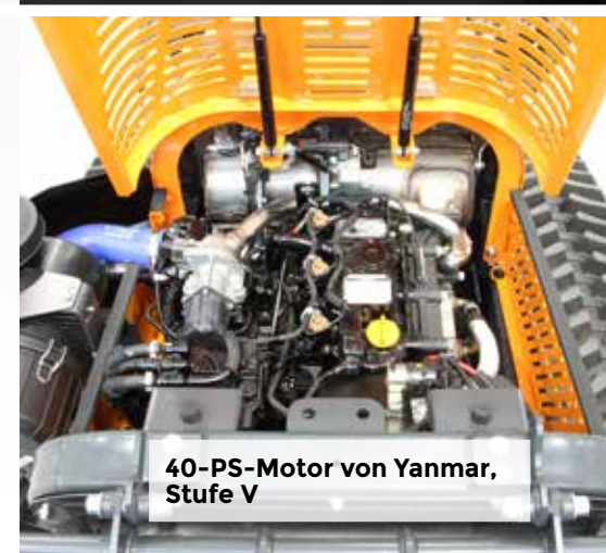
40-PS-Motor von Yanmar, Stufe V