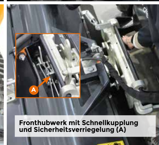
Fronthubwerk mit Schnellkupplung und Sicherheitsverriegelung (A)