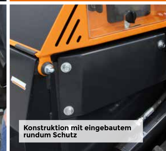
Konstruktion mit eingebautem rundum Schutz