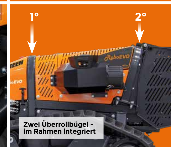
Zwei Überrollbügel - im Rahmen integriert